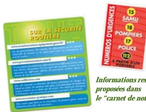
Informations ressources proposées dans le "carnet de notes"

Le 16 novembre : Retour sur l'accident, la notion de responsabilité les uns envers les autres apparaît. Développement d'une stratégie de prévention commune : les tours de garde